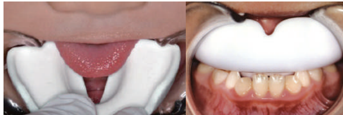
舌を受け皿上にのせる

舌を受け皿の上にのせ、マウスピースを口の中に入れて閉じます。鼻で呼吸ができない、装置があたって痛いなどがある場合は、歯科医師に相談しましょう。