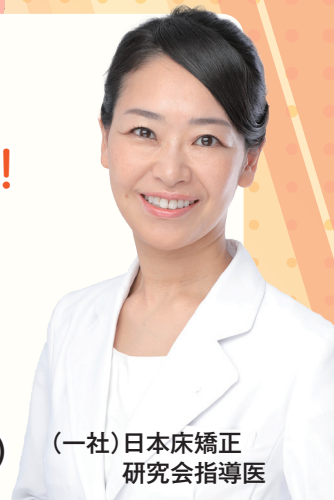
(一社)日本床矯正 研究会指導医