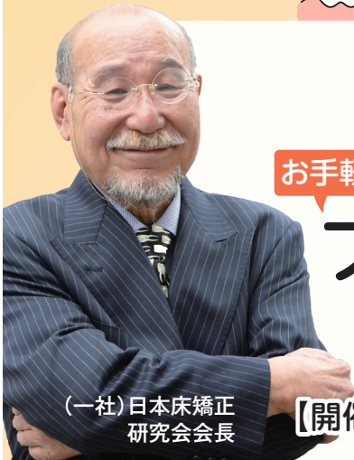
(一社)日本床矯正 研究会会長